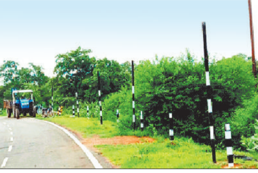
मार्ग पर लगे खंभों से संकेतक बोर्ड हुए गायब।

सरवानी-अफरीद मार्ग में अंधा मोड़ पर राहगीरों को सचेत करने के लिए लगे रेंडियम सिग्नल संकेतक बोर्ड को असामाजिक तत्व ने एक-एक गायब कर दिया है। अब मार्ग के अंधा मोड़ रास्ते पर अब एक ही संकेतक बोर्ड नहीं है। इस मार्ग पर चलने वाले राहगीरों को हमेशा रात के अंधेरे में अंधा मोड़ रास्ते पर दुर्घटनाओं की आशंका बनी रहती है। गौरवलेख है कि सड़क निर्माण होने के बाद विभाग द्वारा मार्ग में राहगीरों को जानकारी देने व सुरक्षित वाहन चलाने के लिए जगह-जगह संकेतक बोर्ड लगाया जाता है। संकेतक बोर्ड लगने से राहगीरों को भी वाहन चलाने समय इसके माध्यम से सुरक्षित वाहन चलाने की जानकारी मिलती है, लेकिन अब असामाजिक तत्वों द्वारा इसे भी नहीं बख्शा जा रहा है। बहनीडीह ब्लॉक के ग्राम सरवानी से होते हुए झर्रा, पंचोरी, अफरीद मार्ग पर खतरनाक अंधा मोड़ पर