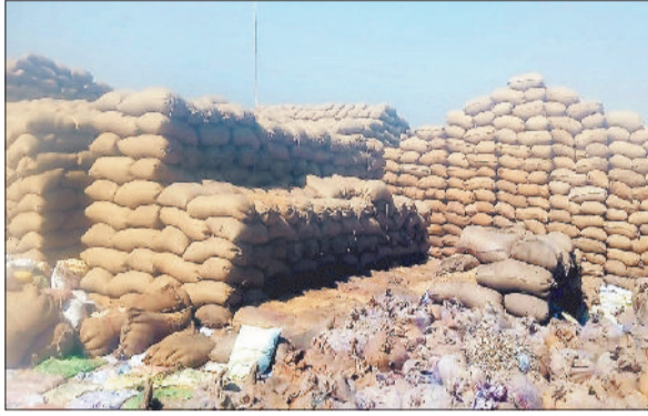
उपार्जन केंद्र में रखा धान।

राज्य शासन द्वारा 15 नवंबर से शुरू की गई धान खरीदी 30 जनवरी को समाप्त हो गई। इस सीजन जिले में धान बेचने के लिए 1 लाख 25 हजार 570 किसानों ने अपना पंजीयन कराया था। निर्धारित तिथि तक 1 लाख 17 हजार 751 किसान ही समर्थन मूल्य पर धान बेच सके। इन किसानों ने 129 उपार्जन केंद्रों के माध्यम से 60 लाख 96 हजार क्विंटल धान बेचा। करीब 8 हजार किसान धान बेचने से वंचित रह गए। सरकार द्वारा बनाए गए कड़े नियम के फेर में बहुत से किसान अपना धान नहीं बेच सके। इससे लगातार विरोध के स्वर उठने लगे। किसानों