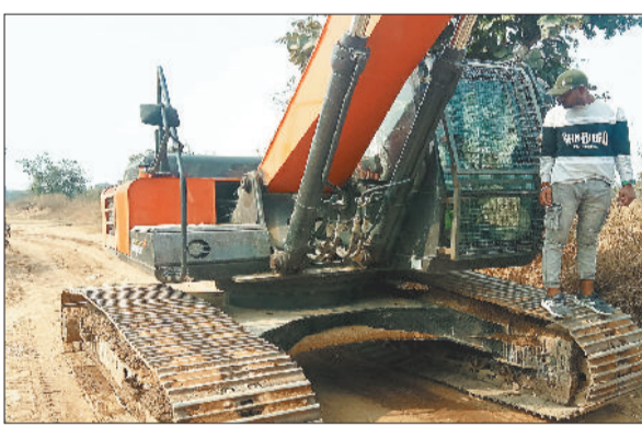
रेत के अवैध उत्खनन पर संयुक्त उडनदस्ता टीम ने कार्रवाई की है।

रेत के अवैध कारोबार पर रोक लगाने प्रशासन ने संयुक्त टीम बनाई है। राजस्व एवं खनिज विभाग द्वारा संयुक्त कार्यवाही करते