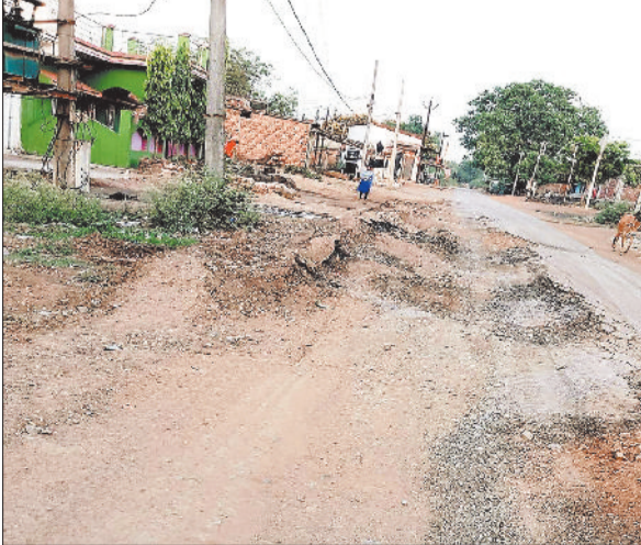
देवरी तनौद मार्ग पर बने गड्ढे।

देवरी मोड़ से तनौद भुईगांव की ओर जाने वाली सड़क बदहाल हो चुकी है। राहगीर कीचड़ और गमीं के दिनों धुल से परेशान होते हैं। देवरी मोड़ से तनौद भुईगांव 13 किलोमीटर सड़क में बड़े बड़े गड्ढे होने से घंटों समय लगता है। 13