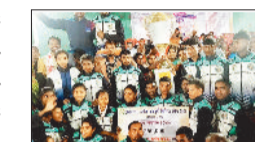
गोंडवाना फ़ाइटर पचरी (दल्हा) को 10 हजार रुपये एवं ट्रॉफी, चतुर्थ पुरस्कार जय बजरंग दल अकलतरा को 7 हजार रुपये एवं ट्रॉफी प्रदान की गई।

अकलतरा। ग्राम अकलतरा में अकलतरा ब्लॉक कबड्डी प्रीमियर लीग का आयोजन 1 से 3 फरवरी तक किया गया। प्रतियोगिता में बालक एवं बालिका वर्ग के लिए प्रथम, द्वितीय, तृतीय एवं चतुर्थ पुरस्कार अलग-अलग निर्धारित किए गए थे।