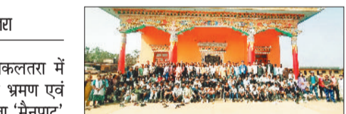
अघोर विद्यापीठ के विद्यार्थियों को कराया गया मैनपाट का एकदिवसीय शैक्षणिक भ्रमण।