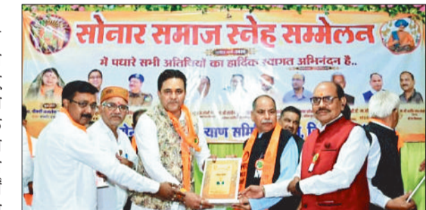
प्रशिक्षण में शामिल स्कूल के स्टाफ।

गुंजन एजुकेशन सेंटर में कक्षा 12वीं के छात्र-छात्राओं के लिए विदाई समारोह का आयोजन गरिमाय एवं भावनात्मक वातावरण में किया गया। इस अवसर पर विद्यार्थियों ने अपने शैक्षणिक सफर की स्मृतियों, संघर्षों और उपलब्धियों को साझा करते हुए शिक्षकों के प्रति आभार व्यक्त किया।