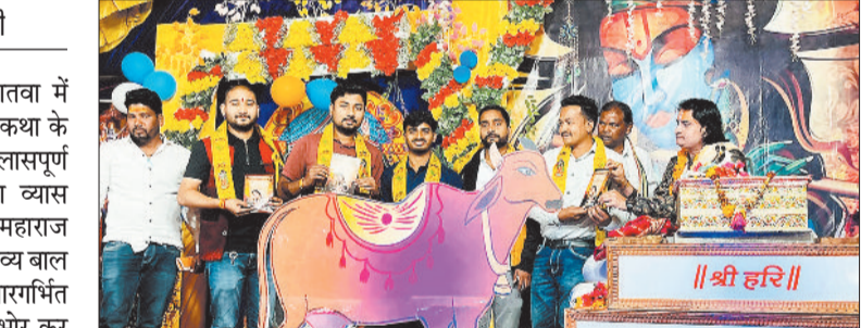
कथा सुनने पहुंचे श्रद्धालु।